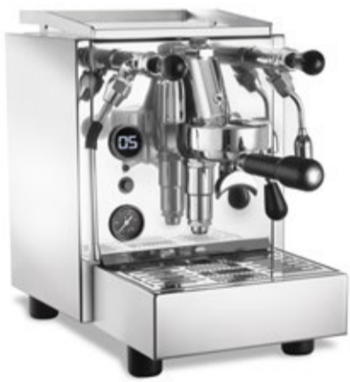
De ACM Homey met E61 groep en push kranen.