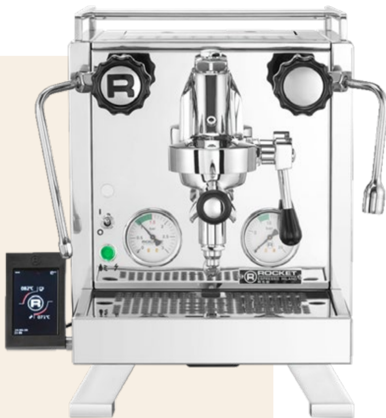
Paradepaardje R Cinquantotto.

De machines zijn een vaste waarde in ons gamma geworden. Met de Giotto,