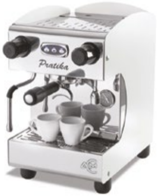
De ACM Praktika is een compacte machine met programmeerbare doseringen.